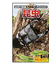
「昆虫」 (学研プラス) 501167460