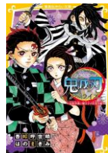
「鬼滅の刃 9」 501191232