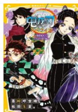
「鬼滅の刃 6」 501191205