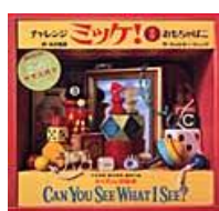
「チャレンジミッケ! 1」 501123279