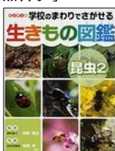
「学校のまわりでさがせる生きもの図鑑」 昆虫2 501140841