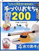
「リサイクル工作であそぼう! ④と⑥」 501188157 501188175