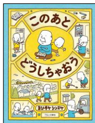
【 このあと どうしちゃう 】 ヨシタケシンスケ 作