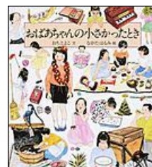
【 おばあちゃんの小さかったとき 】 おち とよこ 文 ながた はるみ 絵

「じいじは、どうして中国で 迷子になってしまったのか」 3さいで親とはなれ、一人で 中国に残されたじいじの実話。