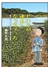
【 じいじが迷子になっちゃった 】 城戸 久枝 著

9月15日は敬老の日、お年寄りを敬う日です。おじいちゃんやおばあちゃんとじっ くり話してみると、みなさんが知らない事を聞かせてもらえるかもしれませんよ。