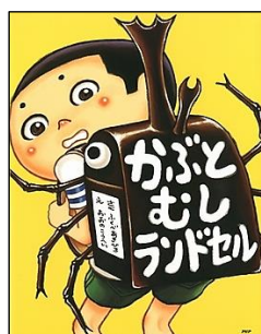
【かぶとむしランドセル】