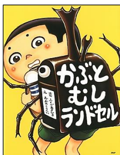
【かぶとむしランドセル】