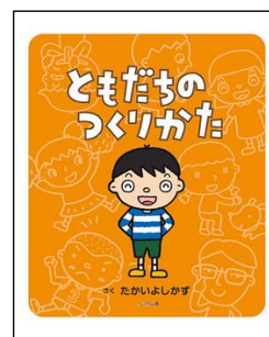
【ともだちのつくりかた】