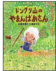
【ドングリ山のやまんばあさん】