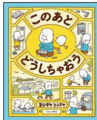
【このあと どうしちゃう】