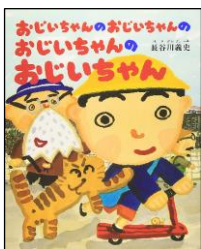
【おじいちゃんのおじいちゃんのおじいちゃんのおじいちゃん】